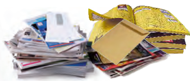
Journaux, catalogues et imprimés