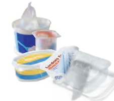
Boîtes et pots en plastique (crème fraîche, yaourts...)