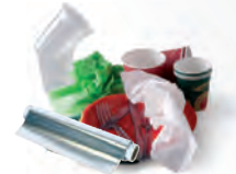
Boîtes, vaisselle jetables, papier aluminium