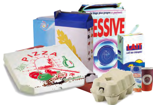
Briques alimentaires et emballages cartonnés