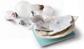
Ampoules à filaments et vaisselle cassée