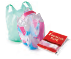
Sacs, films et sachets en plastique