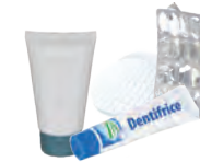
Tubes : beauté et santé Coton, lingettes