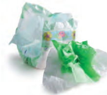
Couches, coton, mouchoirs en papier, papier essuie-tout